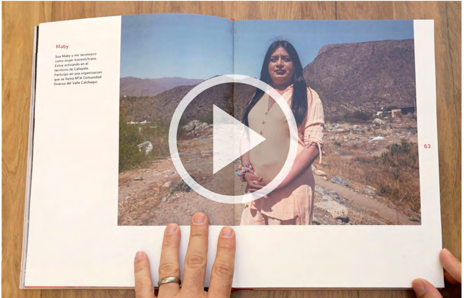
Desplegable doble faz 50x70 cm